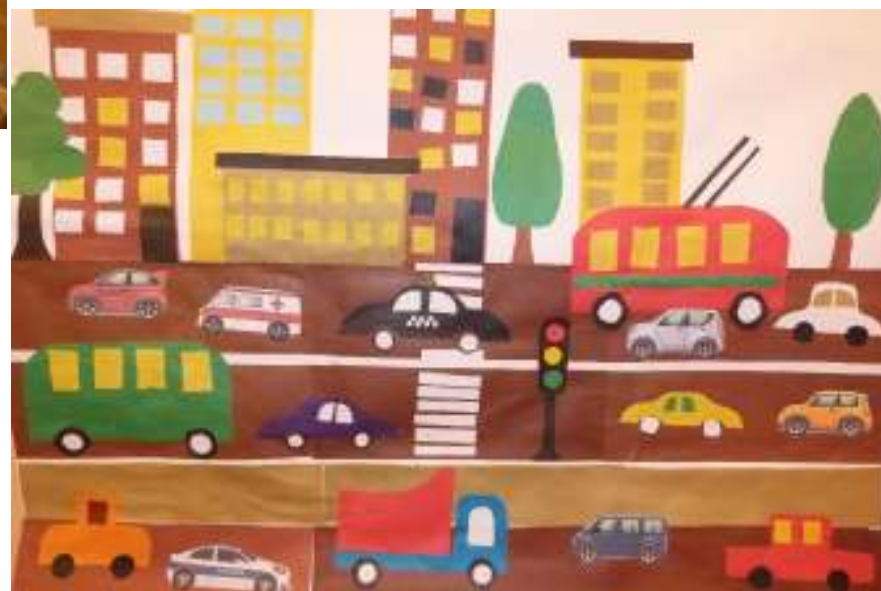
Коллективная аппликация «Улица»