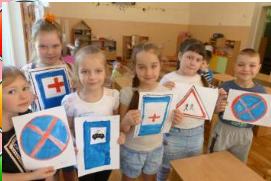
Рисование «Дорожные знаки»